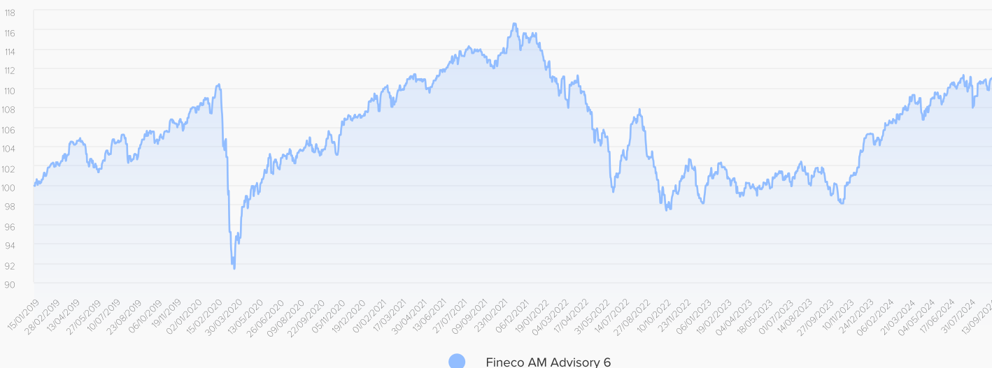
● Fineco AM Advisory 6