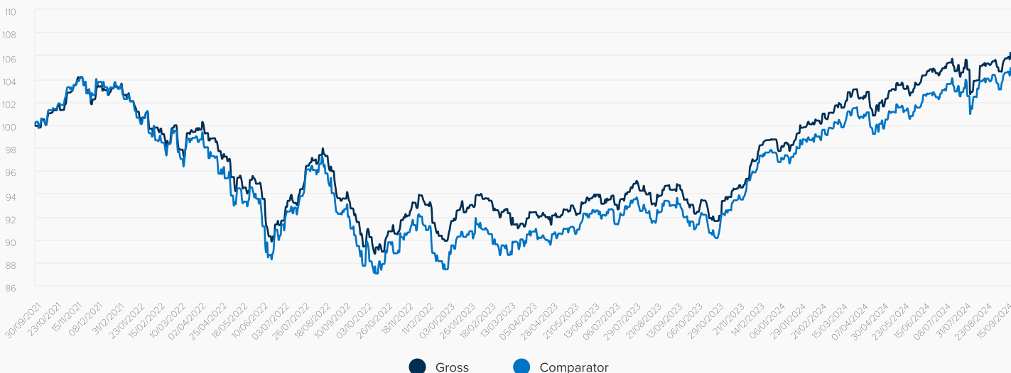
● Gross ● Comparator